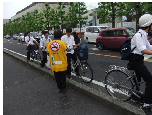
早朝からの活動、お疲れさまでした! (津山駅・津山市役所の様子)