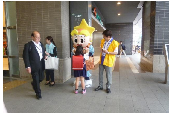
通学途中の女の子とハイタッチ!!