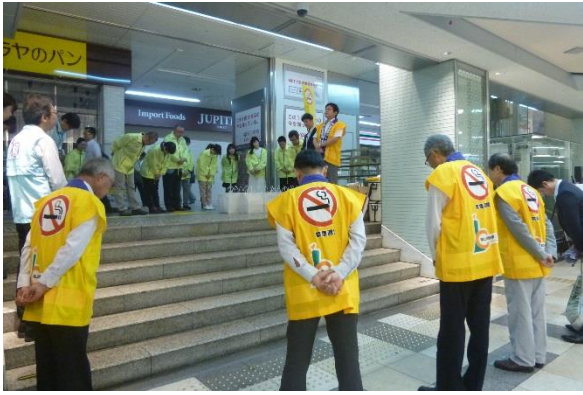
普及啓発頑張りましょう!! (西井会長より開会挨拶)

岡山県禁煙問題協議会では、今年も世界禁煙デー(5月31日)に、普及啓発活動の一環として、JR岡山駅において県や薬剤師会などの協力をいただき、ティッシュと禁煙チラシ(4,000個)を配布し、多くの通学・通勤中の若者を中心に禁煙を呼びかけました。