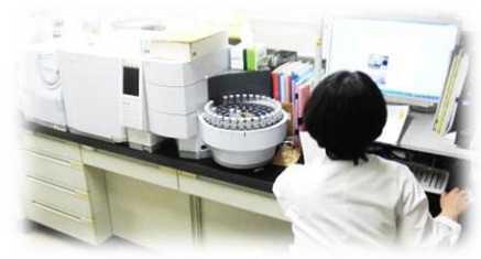
ヘッドスペースガスクロマトグラフ質量分析計(HS-GCMS)