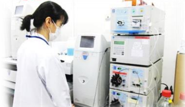
イオンクロマトグラフーポストカラム