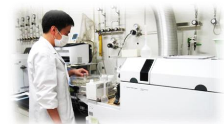
誘導結合プラズマ質量分析計(ICP-MS)