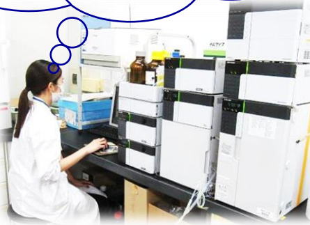
液体クロマトグラフ