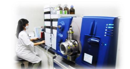
液体クロマトグラフ質量分析計(LC/MS/MS)