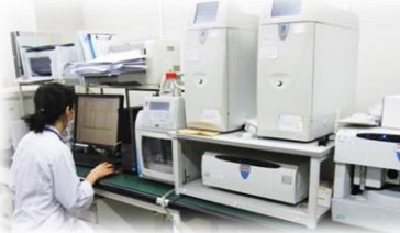
イオンクロマトグラフ